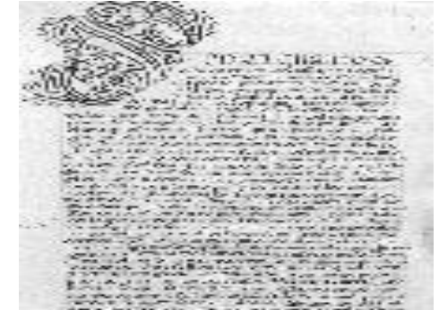
FUERO DE LOGROÑO

Los fueros eran los estatutos jurídicos aplicables en una determinada localidad cuya finalidad era regular: